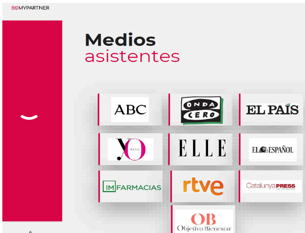
7. Medios asistentes a la Rueda de Prensa, Noviembre, Barcelona.