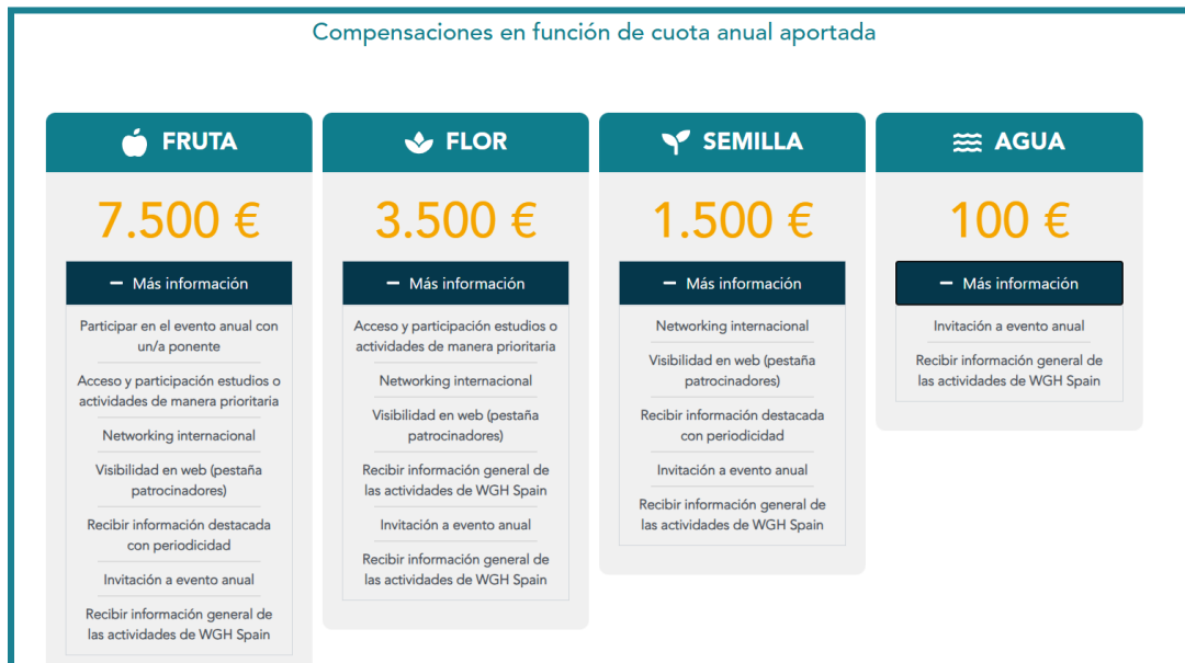
SEQ Ilustración \* ARABIC 6. Cuotas para entidades.